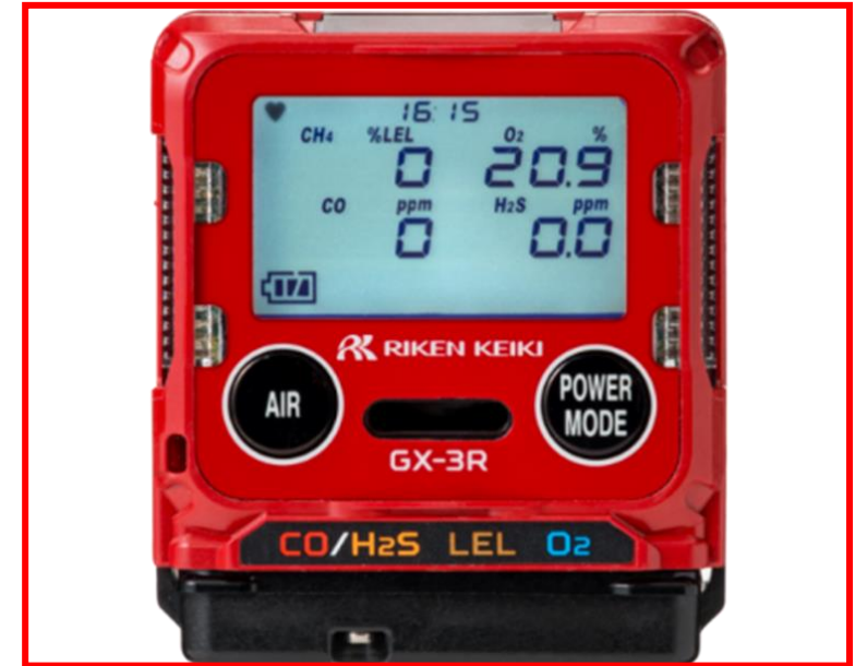
ポータブルガス検知器

ポータブルガス検知器とは、作業現場にて有毒・可燃性のような危険性があるガスの測定器具となります。災害現場では、どのようなガスが発生しているか不明な為、ポータブルガス検知器を使用して作業現場の安全性を確保し、隊員の命を守ることが出来ます。また現在では、Bluetooth対応品もありますので、お客様のニーズに合ったガス検知器を提供いたします。